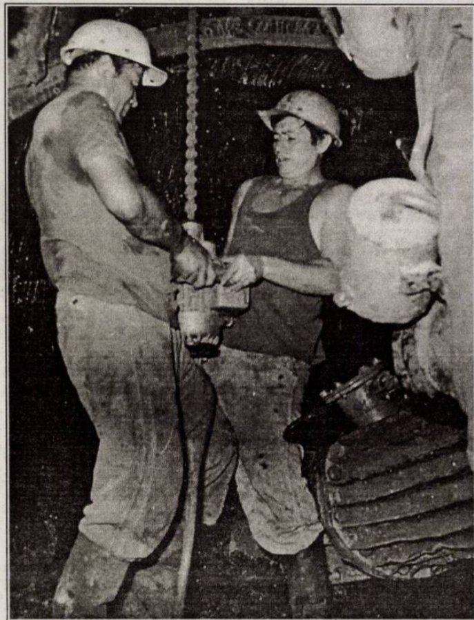
Az archív felvételen a kétemberes fúrógéppel dolgoznak a bányászok.

Egyszóval amikor a Szénbányászati Szerkezetátalakítási Központ, a SZÉSZEK megalakult, nyilván kibuktak a tarthatatlan költségek, s végül kormányhatározat született, miszerint 1996 végéig Edelény-aknát be kell zárni. Ebben a kormányhatározatban ugyanakkor az is szerepelt, hogy három éven át a bánya évi 300 millió forintos támogatásban részesül. A döntőbírók nem számoltak az inflációval, úgyhogy még az első évben talán elég volt a 300